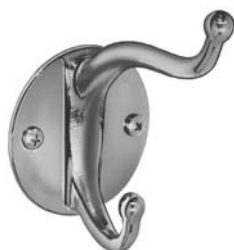
914 GANCHO DOBLE. SE PROYECTA 38 mm y 90 mm (1-1/2" y 3-1/2") DIÁMETRO = 70 mm (2-3/4")