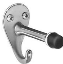
Bradex® 915 GANCHO Y TOPE. SE PROYECTA 76 mm (3")