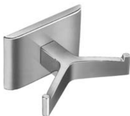
Bradex® 912 GANCHO DOBLE PARA BATA SE PROYECTA 51 mm (2")