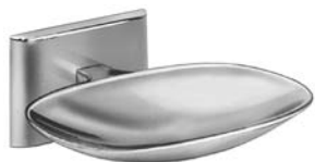
901 JABONERA (SE MUESTRA)